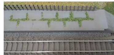
本物と間違えるほどの出来栄